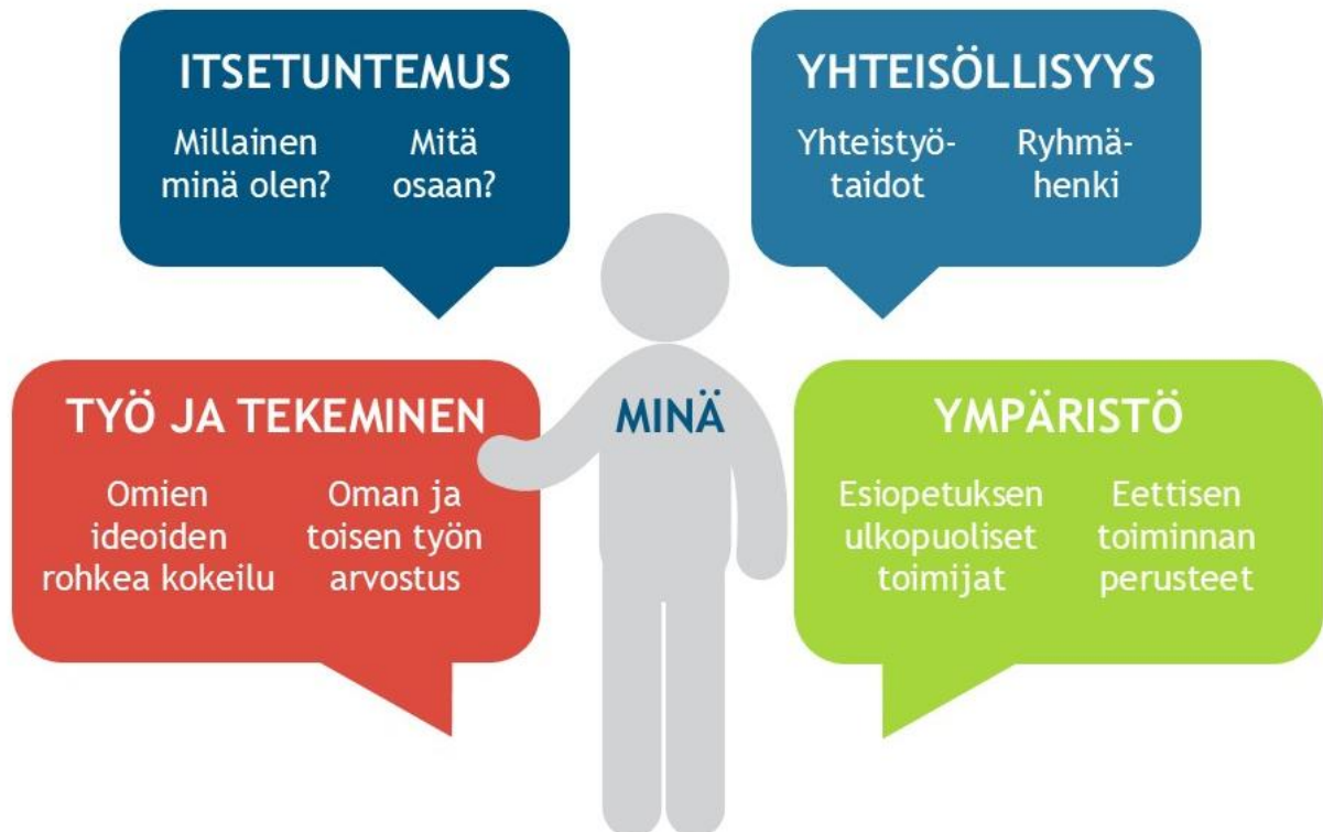
KUVIO Yrittäjämäinen toimintatapa

Yrittäjämäinen toimintatapa on ennen kaikkea asenne ja toimintatapa, jota tarvitaan elämässä, opiskelussa ja tulevassa työssä.